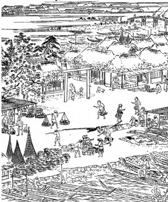
▲寄木明神社（『江戸名所図会』より）