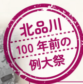
1928(昭和3)年 品川神社 北の天王祭