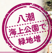
1984(昭和59)年 東京都立大井ふ頭中央海浜公園