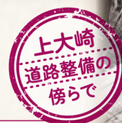
1970(昭和45)年 取り壊される住まい

令和7年(2025)は、 昭和元年から数えてちょうど100年になります。 本展では、大正12年(1923)に発生した 関東大震災後の復興の様子から、 平成に改元する頃までの品川の歩みを、 品川区と当館が所蔵する写真と地図を 中心に紹介いたします。